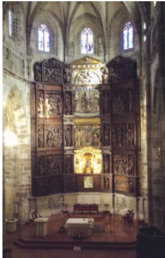
Portugalete, a Mária-templom belseje

Még volt egy említésre méltó esetem, épp Guernicában (baszk neve: Gernika-Lumo , ui. összecsatolták a szomszéd településsel), ahol a városon belül a kimaradt néhány irányjelzés miatt egy bácsitól kértem segítséget, mondván: nem látom a sárga nyilakat (az útikalauz mint fontos tudnivalót említi: flecha amarilla ; szavam ne feledjem, a Caminón roppant egyszerűen oldották meg a tájékozódást, az utak mentén, tereptárgyakon sárgával festett nyilak jelzik az útirányt; tökéletesen egyértelmű: a nyíl hegye Santiago, a távoli cél felé mutat). A