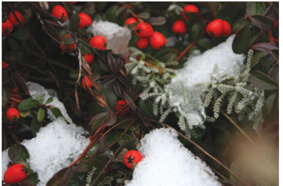
Kásásodik az első hó

(...) Nem zengnek erdeink szép madárszavakkal, Csak csókák kráknak karón a varjakkal. Nincsen gyönyörűség, a természet nyugszik, Fagyos koporsója szüntelen havadzik. Csak ablakainkról nézzük egeinket, S házi játékokkal tartjuk szíveinket.