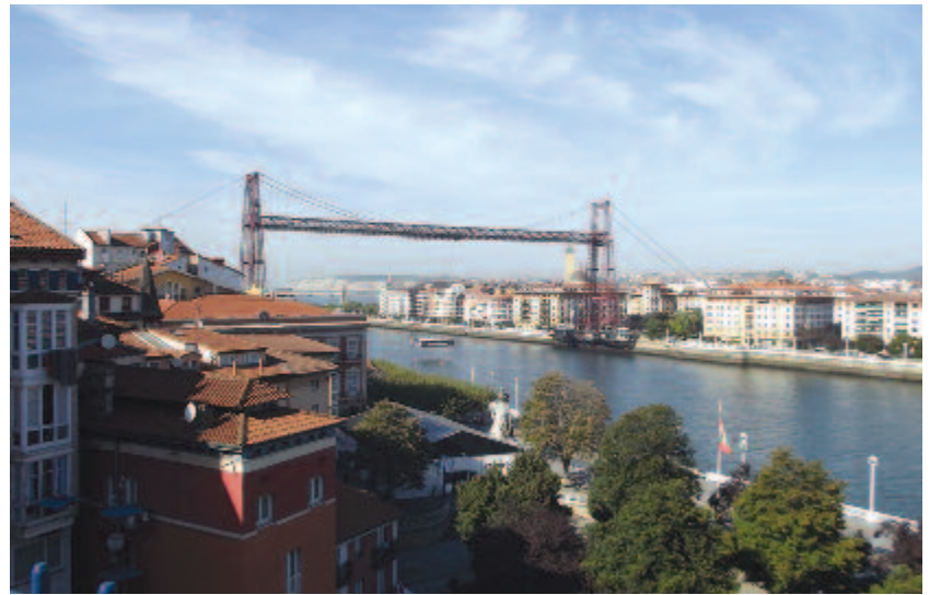
Portugalete, a 100 éves függesztett komp

guel de Meruelo – Güemes – Santander (– Santa Cruz de Bezana).