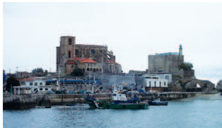
Castro Urdiales temploma és vára

Az én napi adagjaim különböztek mind az egyik, mind a másik beosztástól, részben az időjárás, részben a látványok – vagy nem várt események – alapján osztottam be a távot. (Pl. az egyik kismegemelt szállás október elején bezárt, ezért rá kellett pakolnom még hat kilométert a következőig.) Szeptember 21. és október 5. között a következő állomásokon szálltam meg; ha valaki óhajtja, az internetes világtérképen az ujja begyével végigjárhatja azt, amit én a bakancsaimmal: San Sebastian (Donostia) – Orrio – Zumaia – Izarvide Aterpetxea (erdőszerű szállás, ezután következett egy jó hosszú séta) – Markina-Xemein – Monastireo de Ziortza – Pozueta (tanya, Gernika után) – Portugalete (Bilbao elővárosa) – Pobena (Muskiz) – Castro Urdiales – Liendo – Noja – San Mi-