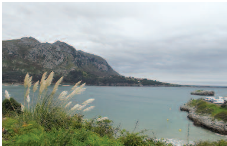
Öböl az óceán partján