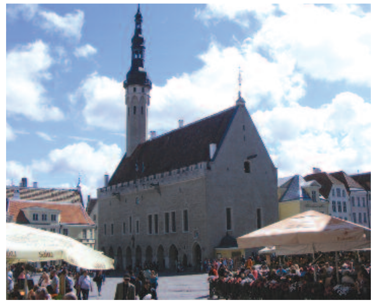
A tallinni városháza